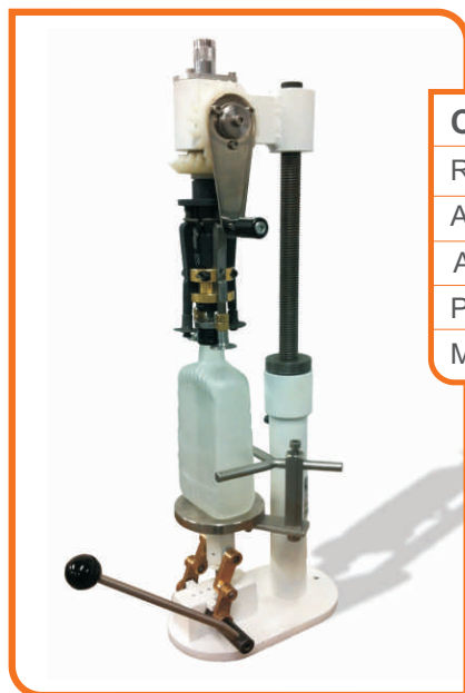
MODELO - "PRE"